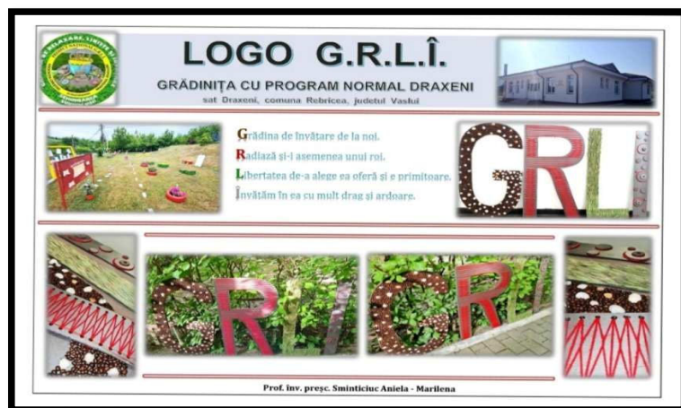
Realizare logo GRLI