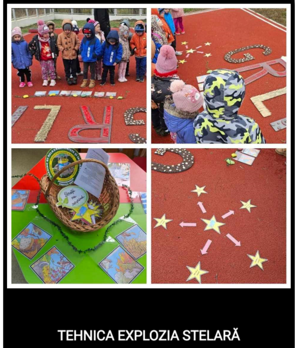
TEHNICA EXPLOZIA STELARĂ