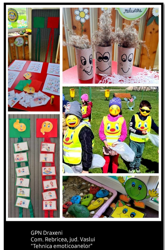
GPN Draxeni Com. Rebricea, jud. Vaslui "Tehnica emoticoanelor"